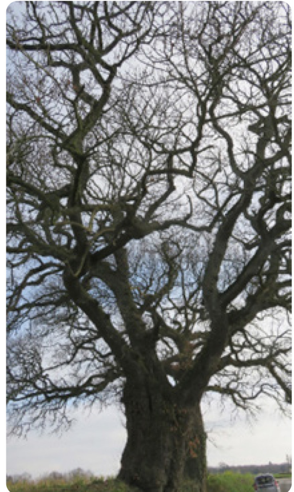
En hiver, une prestance imposante !