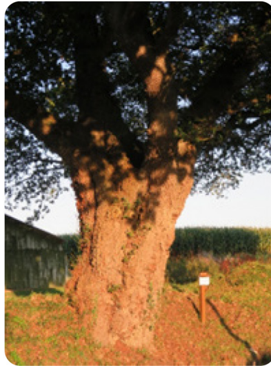
À Kernevez, avec feuillage d'été.

Situé à Kernevez, cet arbre de 6 mètres de diamètre à plus 3 siècles. Il a été planté autour de 1715, année de la mort du roi Louis XIV.