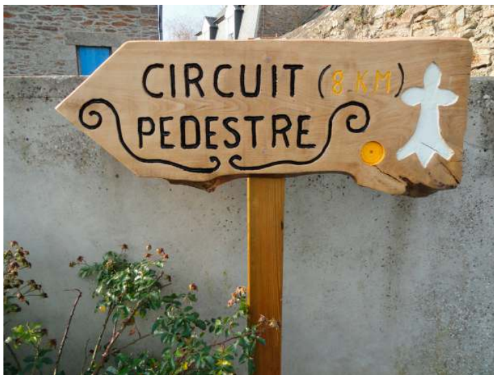
Circuit des calvaires - 8 km - Départ place de l'église

Un châtaignier, avec un tour de tronc de 4 m 80, au lieu-dit « ker halic », et un chêne pédonculé, de 3 siècles environ, dont la base du fût mesure 6 m de circonférence (au lieu-dit « Kernevez »). Apparemment, personne ne savait que depuis 4 années, un recensement avait été lancé par le Conseil général des Côtes d'Armor (Direction Agriculture Environnement) pour aboutir, en novembre 2011, à l'édition d'un magnifique livret présentant les arbres remarquables en