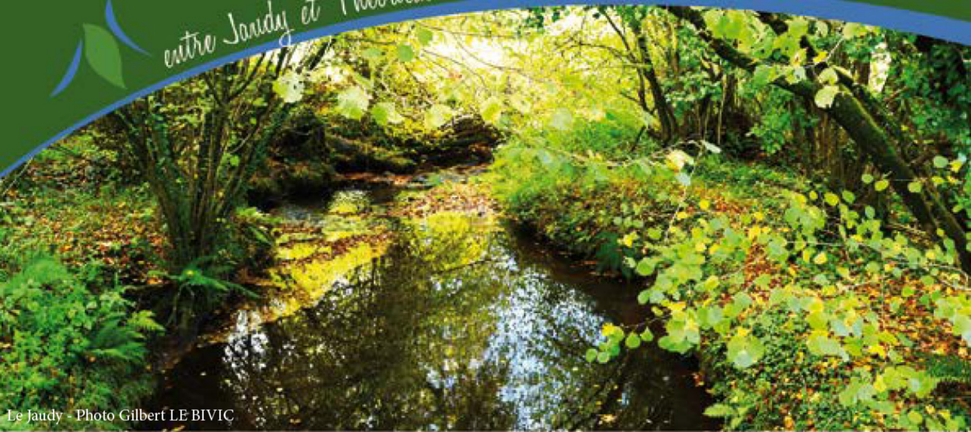
Le Jaudy