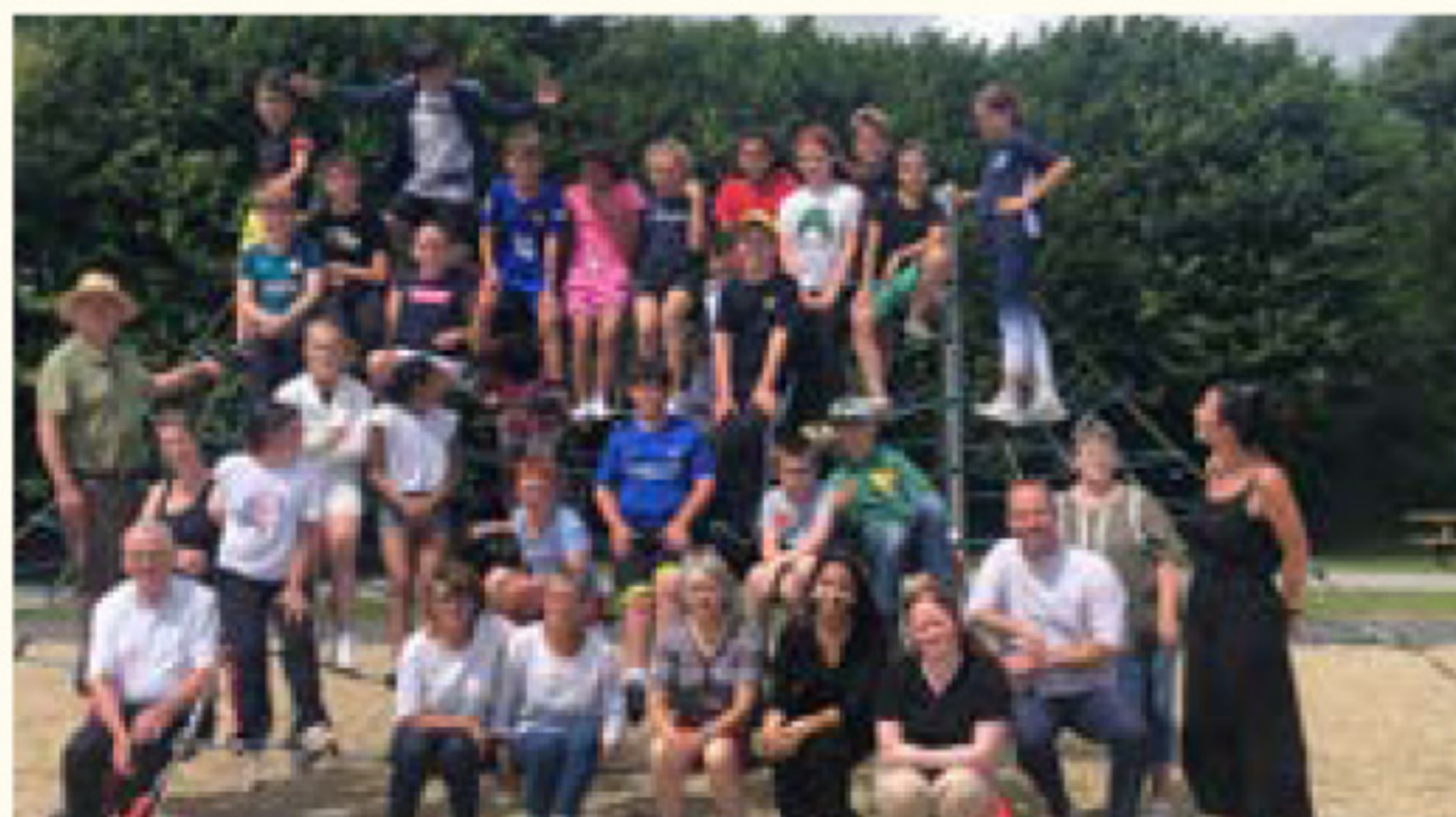
Les élèves de CM2 avec les encadrants